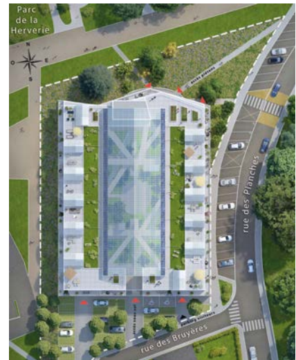
Plan masse de la résidence

Notre ambition est de rendre les futurs résidents fiers de leur adresse et ce, en s'appuyant sur deux clés principales de désirabilité :