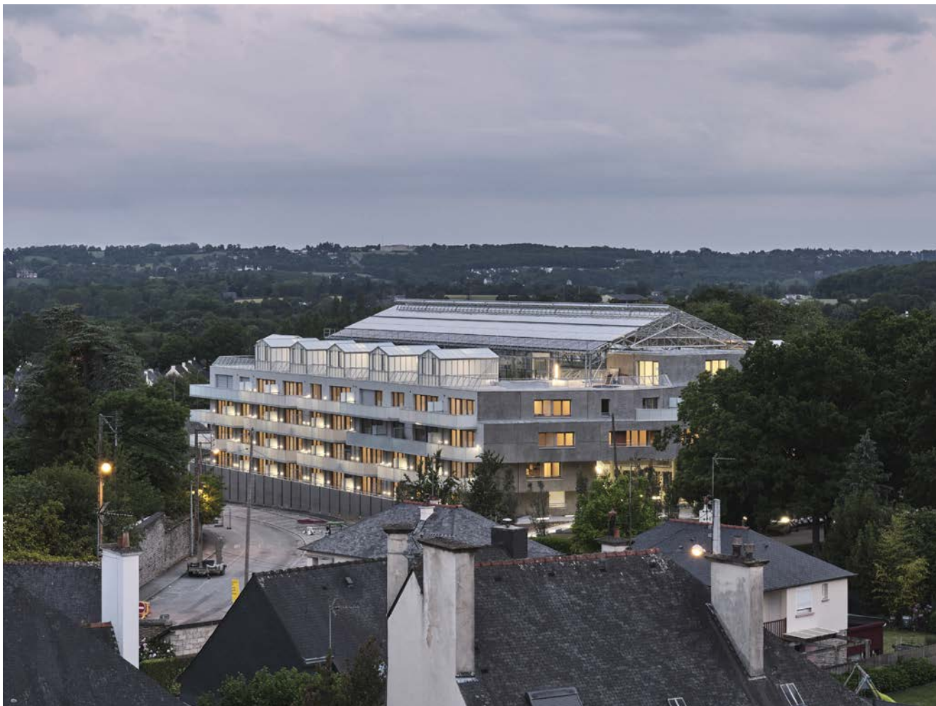
Une silhouette domestique dans le ciel