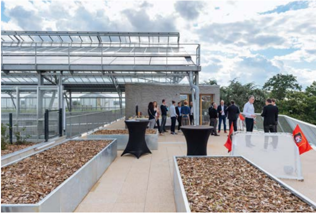
Rooftop partagé accessible à l'ensemble des résidents