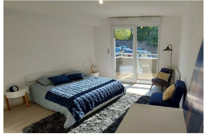
Chambre partagée à disposition des résidents et de leur famille