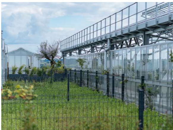
Jardins d'hiver avec terrasse individuelle et jardin pleine terre