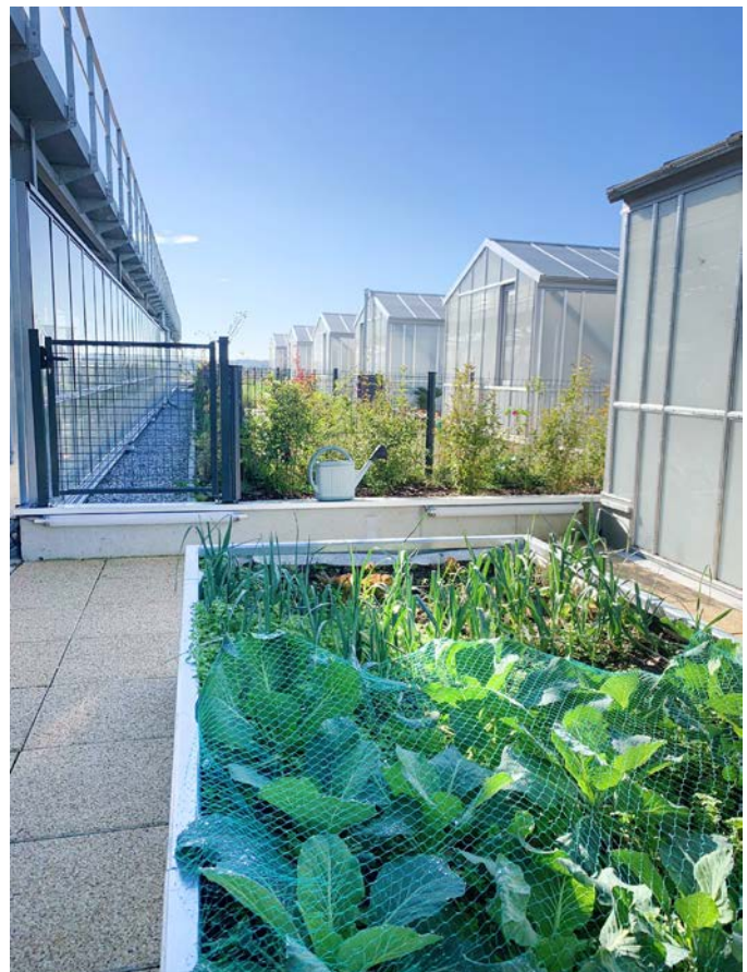
Bacs potagers à la faveur d'une culture hors sol