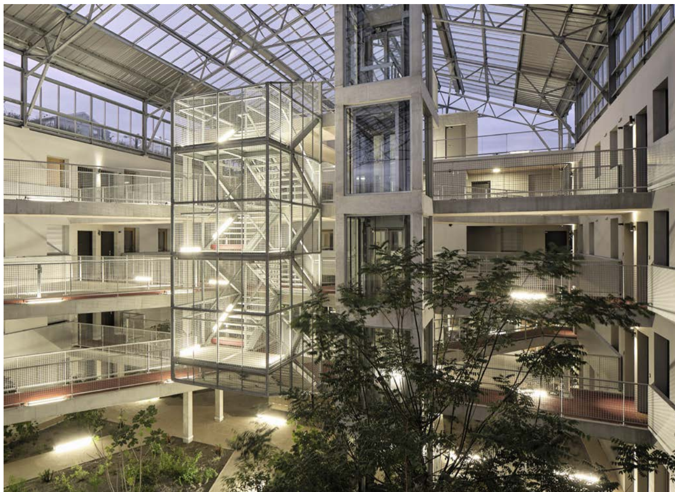
Un atrium très accueillant en verre 100% transparent