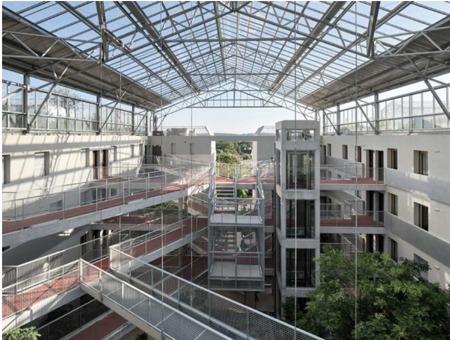
Vue lointaine sur l'horizon

En réactivant plusieurs expériences appartenant à l'histoire de l'architecture, des utopies ouvrières du XIX ème siècle (phalanstère de Fourier, familistère de Godin à Guise...) aux utopies technologiques du XX ème siècle (les serres habitables rêvées par Buckminster Fuller...) un concept fort fondé sur l'utopie sociale est né.