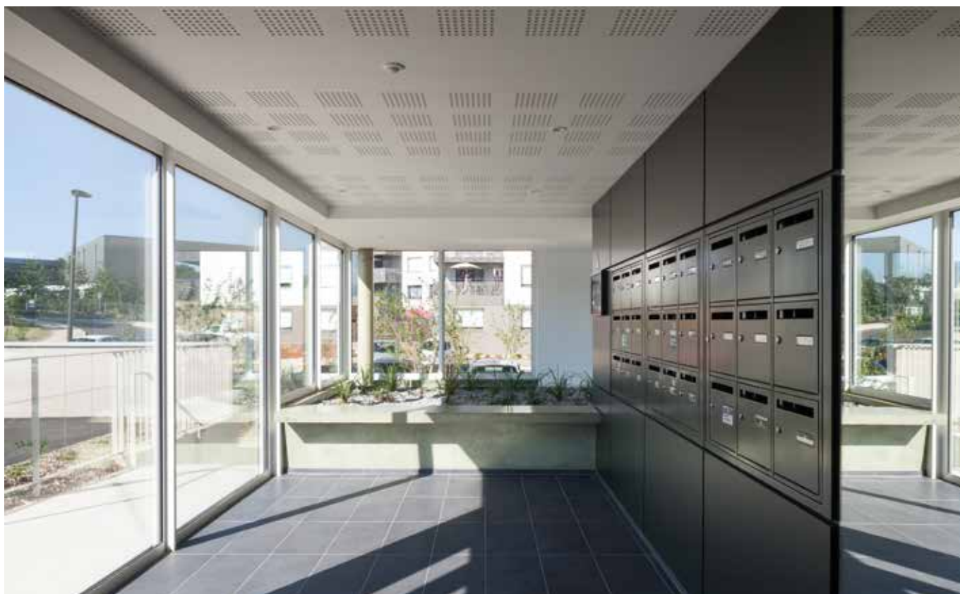
Azur - Réalisation Groupe LAUNAY