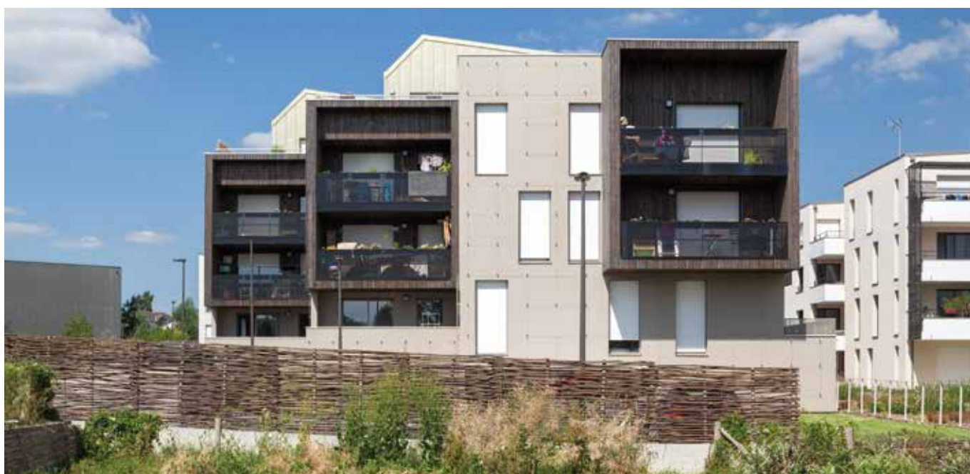
Azur - Réalisation Groupe LAUNAY

La densité du projet, représentant près de 100 logements à l'hectare, est gérée intelligemment à l'échelle de l'îlot et en couture avec l'existant. Les implantations des constructions, ainsi que leur hauteur tiennent compte de la topographie du site et des habitations environnantes. Les vis-à-vis sont évités et les ombres portées limitées, en développant des épaulements dégressifs.