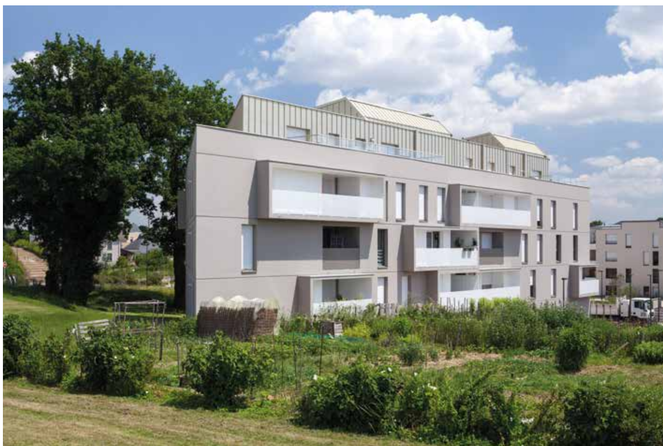
Signature - Réalisation Groupe LAUNAY