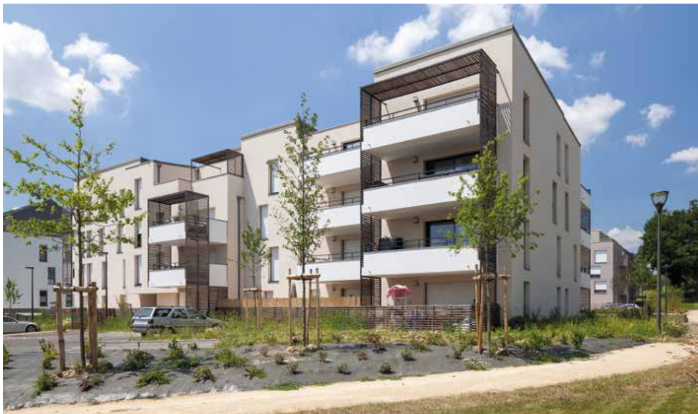
Allure - Réalisation Groupe LAUNAY