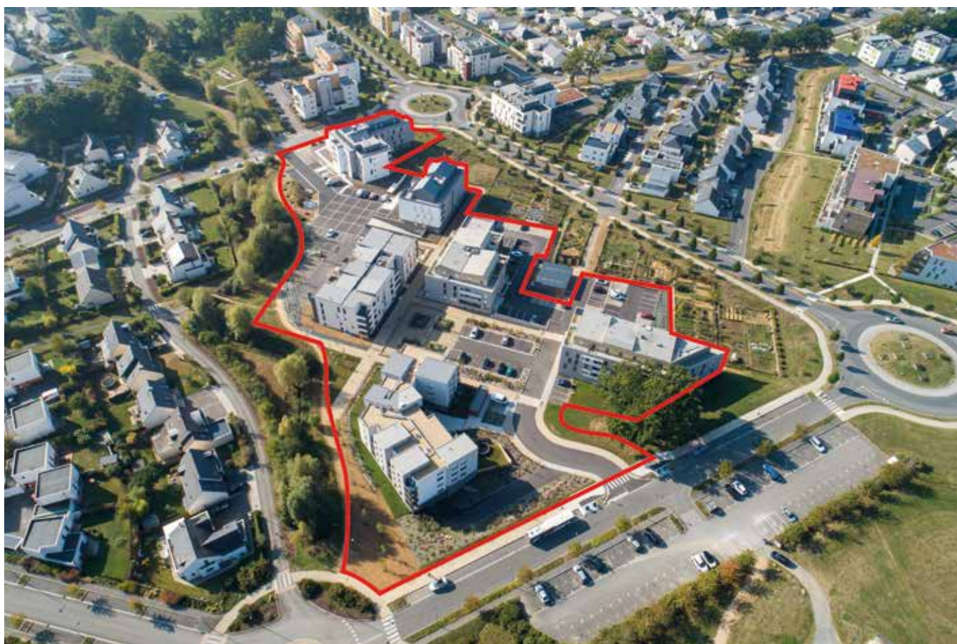
Vue aérienne macro-lot C20