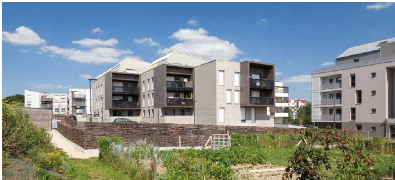
Azur - Réalisation Groupe LAUNAY