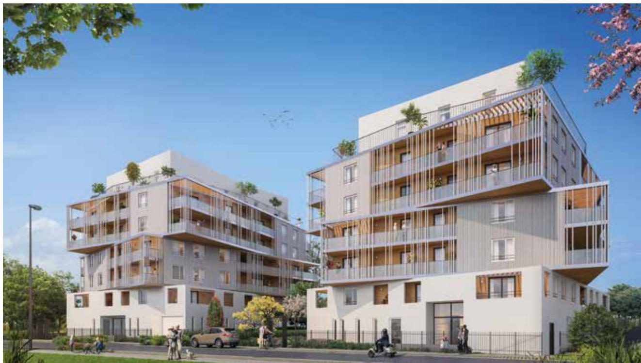
Twisty - Réalisation Groupe LAUNAY