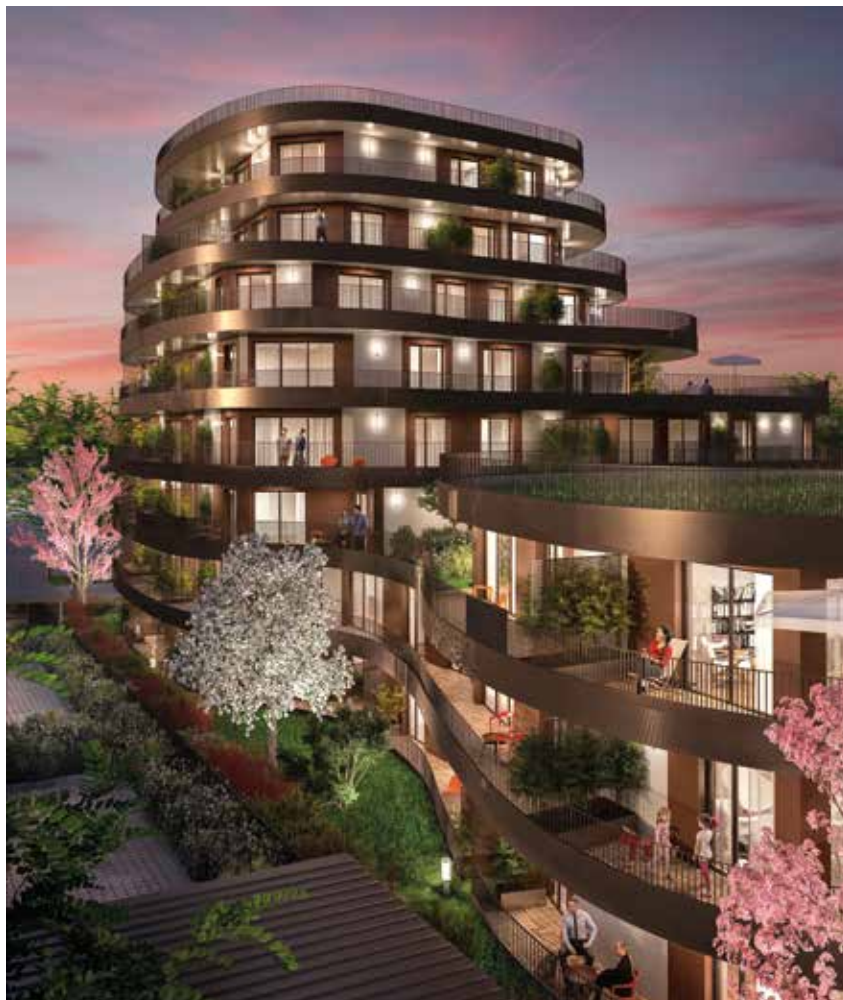
Wavy - Réalisation Groupe LAUNAY