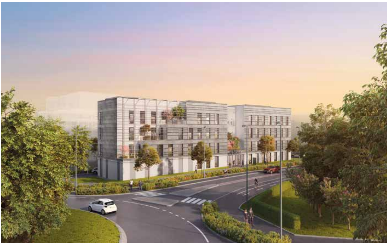
Lobby - Réalisation Groupe LAUNAY