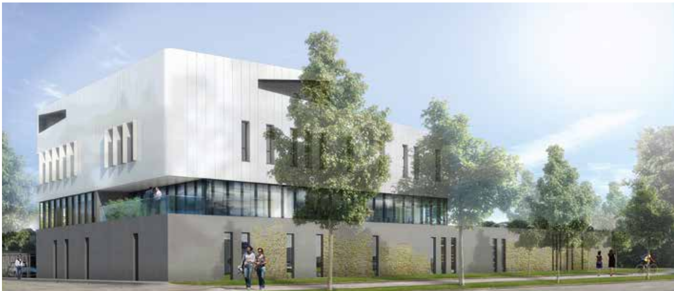
Siège de DXM - Réalisation Groupe LAUNAY

Idéalement situés en entrée de ville, Les Hauts de Sévigné bénéficient d'un emplacement privilégié pour faciliter le quotidien, en connexion avec une multitude de services.