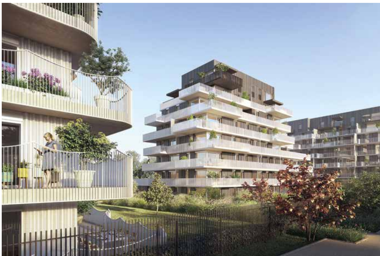
Inky - Réalisation Groupe LAUNAY