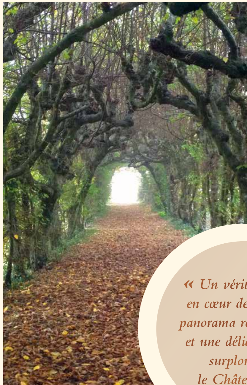
Photo de l'allée de Charmille existante

« Un véritable cocon en cœur de ville, un panorama remarquable et une délicieuse vue surplombant le Château... »