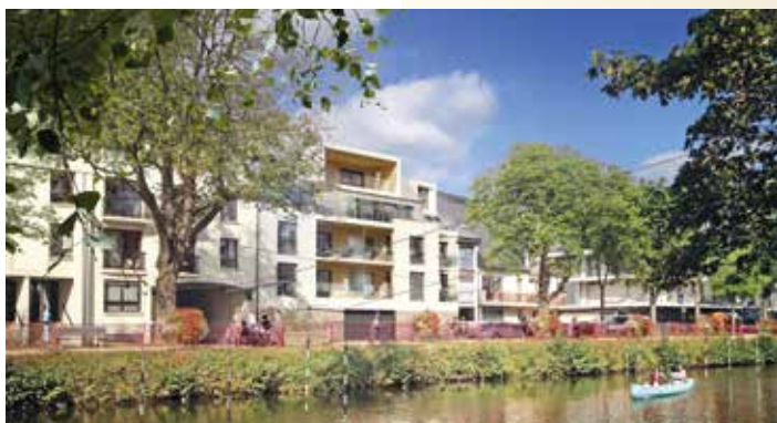
Villa d'Este - Cesson-Sévigné