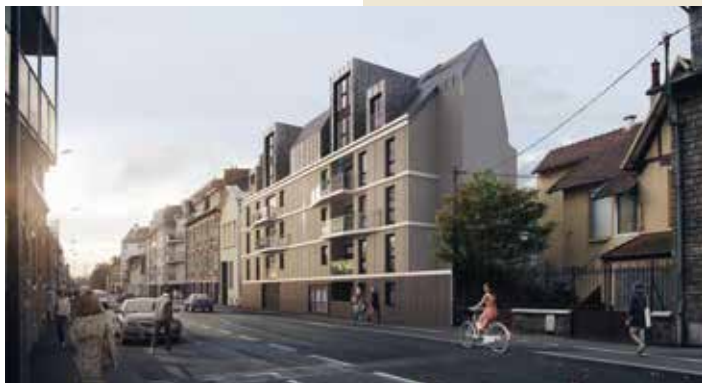
Icone - Rennes