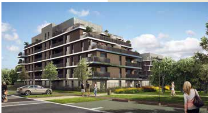
Harmony - Cesson-Sévigné