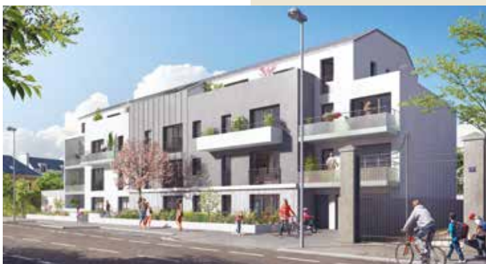
Subti'L - Nantes