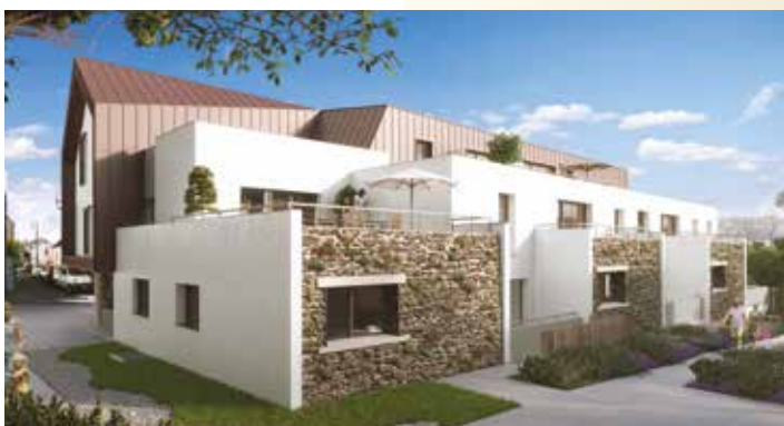
Le Clos des Baronnies - Nantes