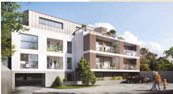
Poesy - Nantes