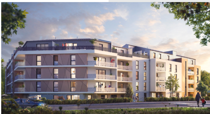
Grand Angle - Bruz