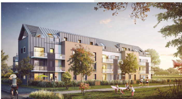
Villa Solea - Pont-Péan