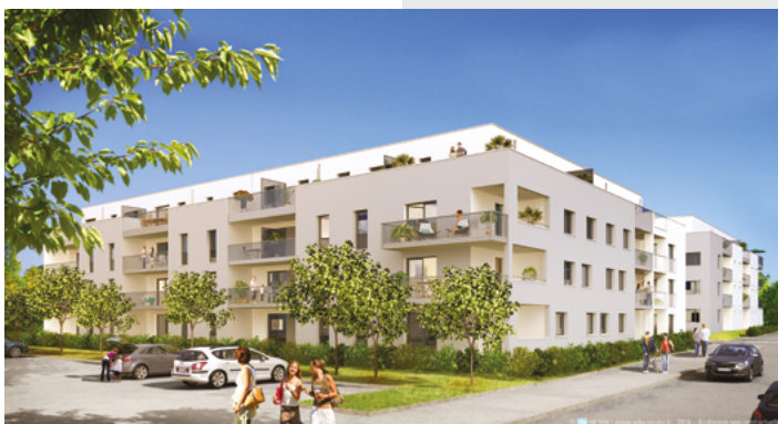
Cœur Émeraude - Chartres-de-Bretagne