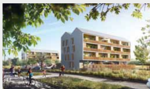
Villas Verde à CHARTRES-DE-BRETAGNE

Résidences proposées par le Groupe Launay sur Rennes et sa région :