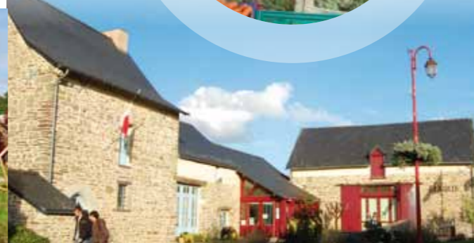
Commune de Rennes Métropole