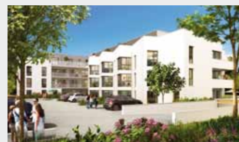
Cœur Emeraude à CHARTRES-DE-BGNE

Contactez notre service commercial au 02 99 350 800