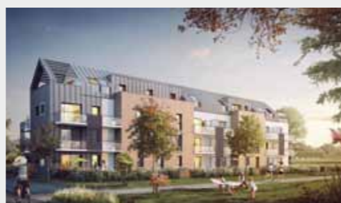
Villa Soléa à PONT-PÉAN