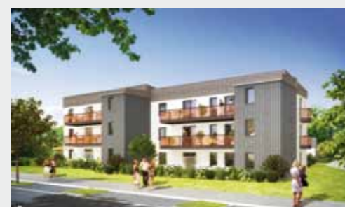
Villa Floréa à BOURGBARRÉ

Contactez notre service commercial au 02 99 350 800