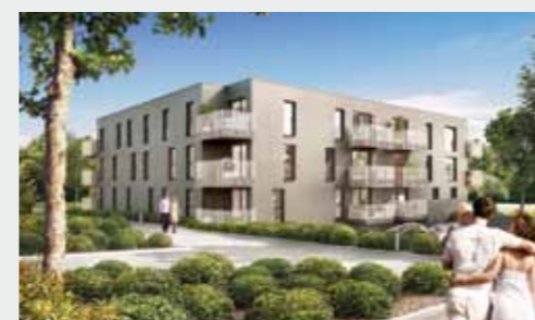
Patio du Parc à BRUZ