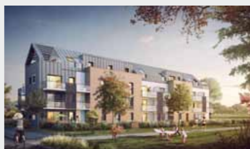
Villa Soléa à PONT-PÉAN

Résidences proposées par le Groupe Launay sur Rennes et sa région :