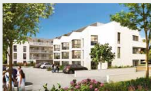
Cœur Emeraude à CHARTRES-DE-BRETAGNE