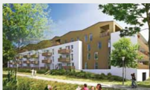
Cassiopée à COUÉRON