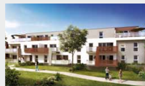
Les Essentielles à VERTOEU