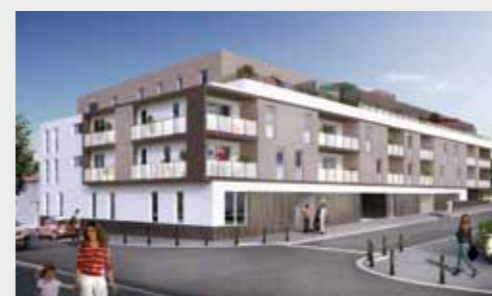
Villa Marquise à CARQUEFOU

Contactez notre service commercial au 02 40 411 000