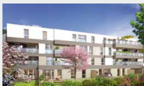
Villa Procé à NANTES

Résidences proposées par le Groupe Launay sur Nantes et sa région :