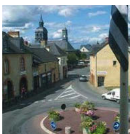
Centre-bourg de Pacé