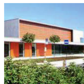
Salle du Ponant