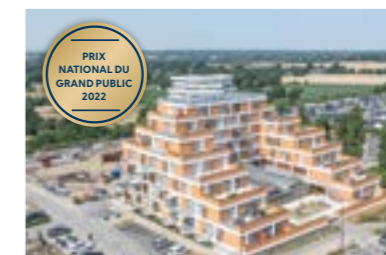
Happy, Cesson-Sévigné (35)