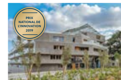
Utopia, Bruz (35)