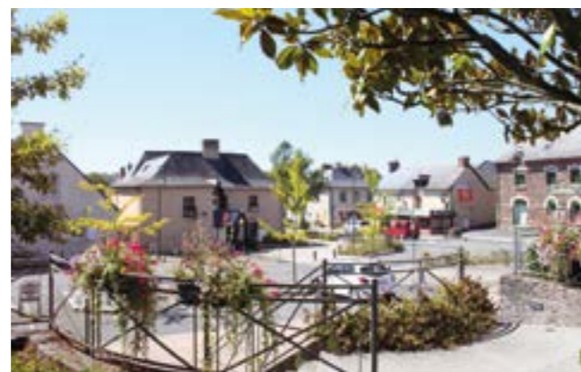
Le centre-ville, Veizin-le-Coquet