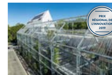
Ekko, Bordeaux (33)