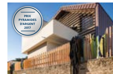
Le Clos des Baronnie, Nantes (44)