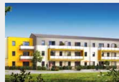
Villa des Arts à PONT-PÉAN

Contactez notre service commercial au 02 99 350 800