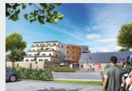
Les Terrasses de Cucé à CHANTEPIE