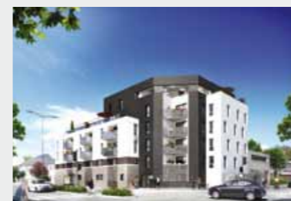
Villa Bel-Air à RENNES