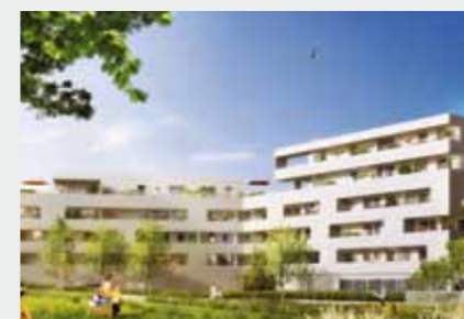
Quartz à RENNES