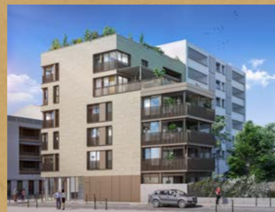
Palazzo Lyon 3