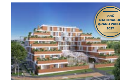
Happy, Cesson-Sévigné (35)