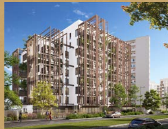
Céleste Lyon 8