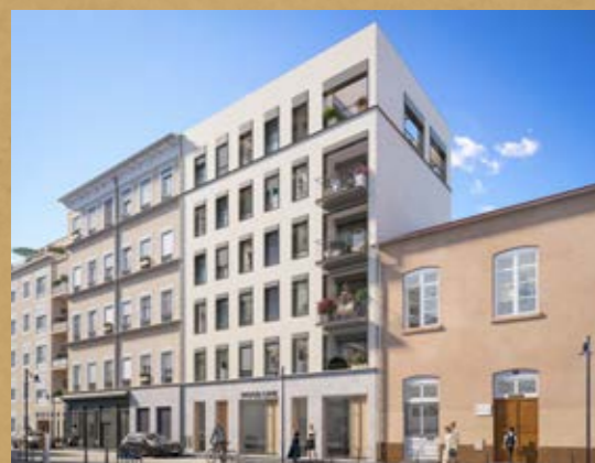
Wood Line Lyon 7