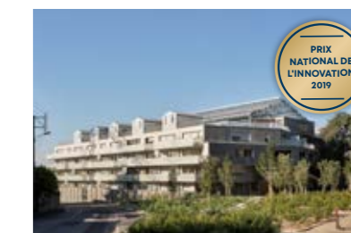
Utopia, Bruz (35)