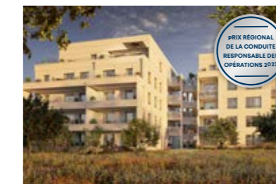
Villas Marly, Givros (69)