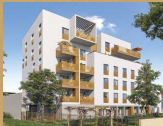
Park Lane Villeurbanne