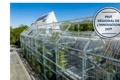
Ekko, Bordeaux (33)