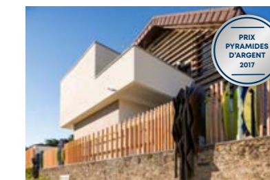
Le Clos des Baronnie, Nantes (44)