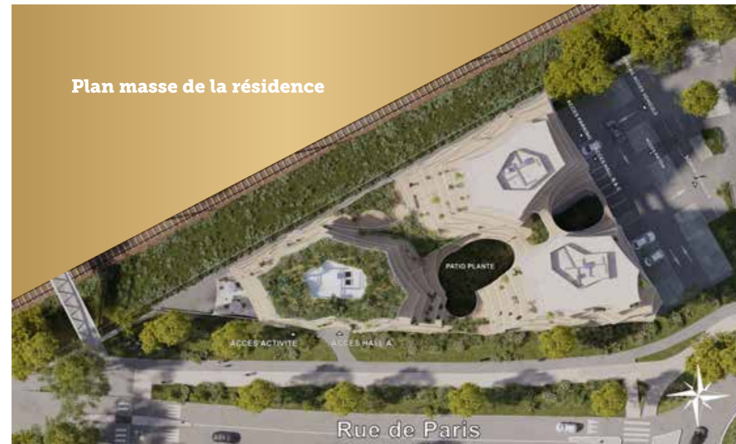
Plan masse de la résidence