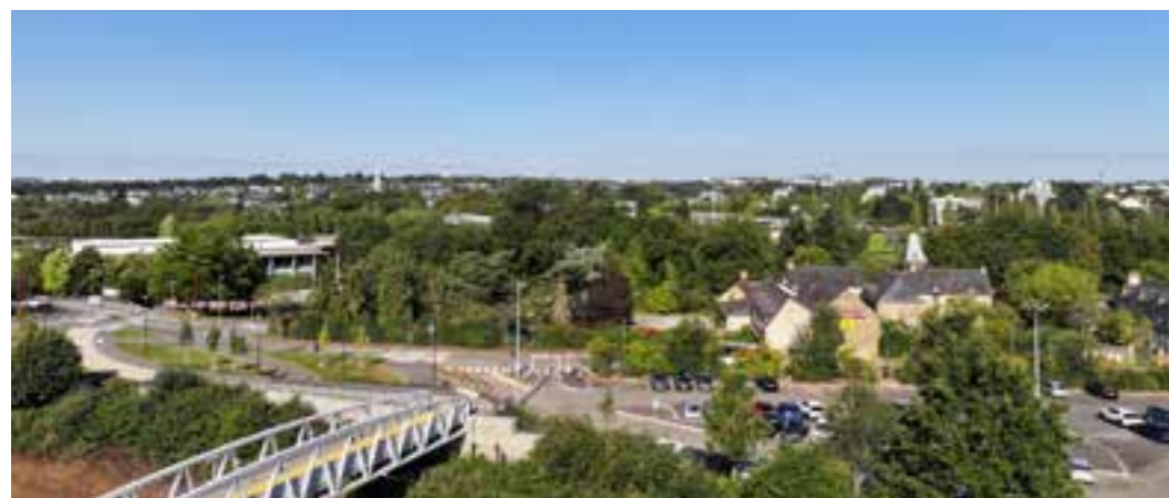
Vue spectaculaire sur la ville de Cesson-Sévigné et son cadre verdoyant

L'architecture contemporaine de chaque bâtiment et la noblesse du mobilier urbain subliment cette nature environnante et font des Hauts de Sévigné un lieu unique à l'identité forte et charismatique.