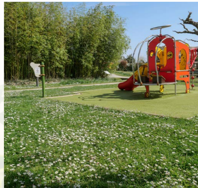
Aire de jeux du parc du Presbytère