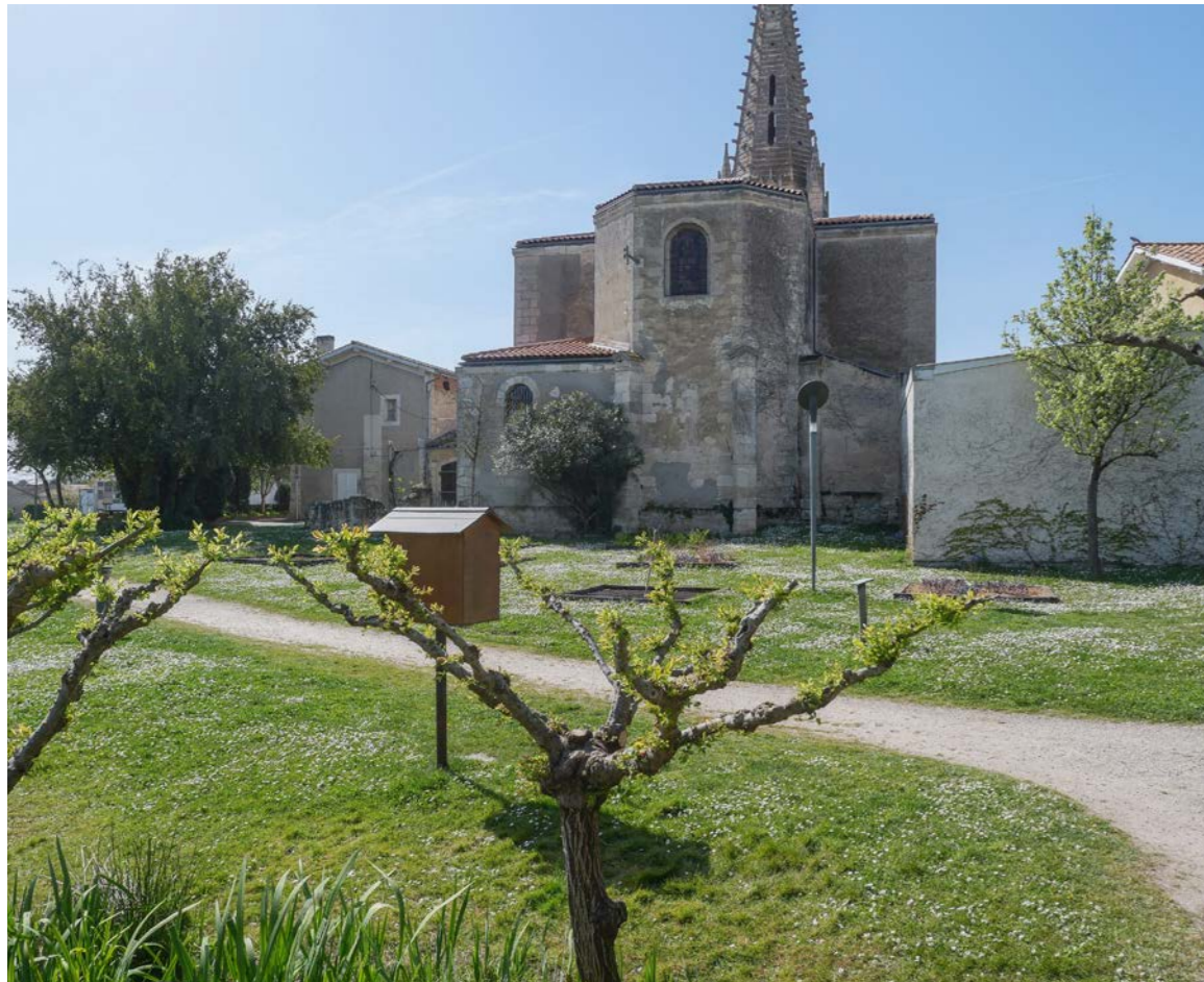
Église Saint-Hilaire et parc du Presbytère

Située au cœur des célèbres vignobles du Médoc à quelques kilomètres de Bordeaux, la charmante commune du Taillan-Médoc allie harmonieusement la tranquillité d'une petite localité à la proximité des commodités urbaines.