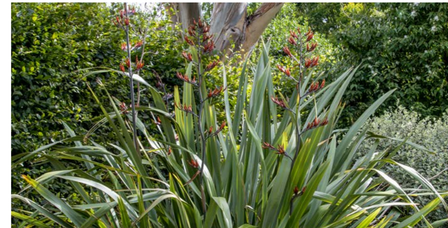
Lin de Nouvelle-Zélande