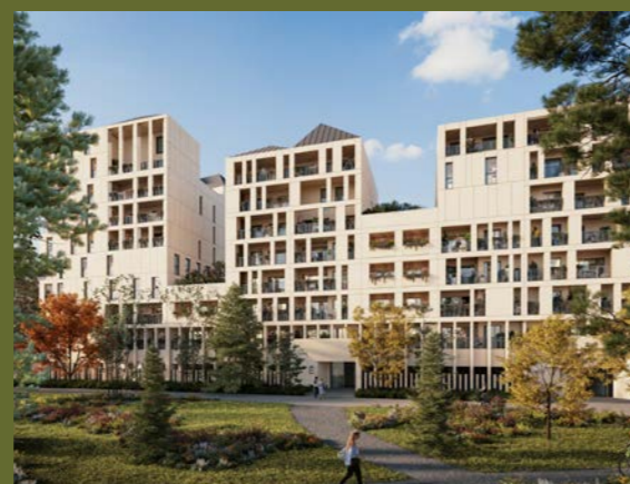
ESPRIT BASTIDE Bordeaux