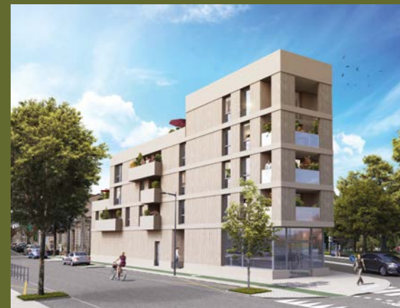
BEL AIR Bordeaux