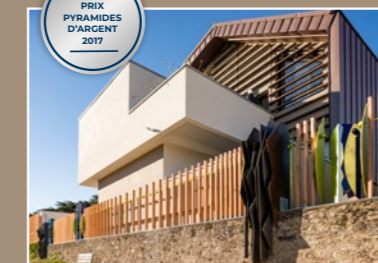
Le Clos des Baronnie, Nantes (44)