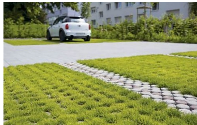
Aire de stationnement verte

Dans une logique de développement durable, une peinture à base d'algues naturelles sera utilisée et la façade sud de la résidence sera traitée avec une isolation biosourcée .