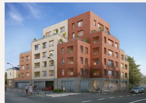
KALIA Rennes (Saint-Martin)