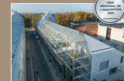
Ekko, Bordeaux (33)