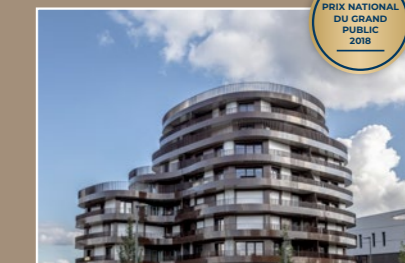
Wavy, Cesson-Sévigné (35)