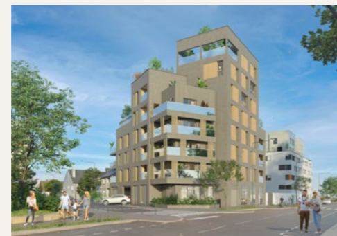
TRENDY Rennes (Jeanne d'Arc)