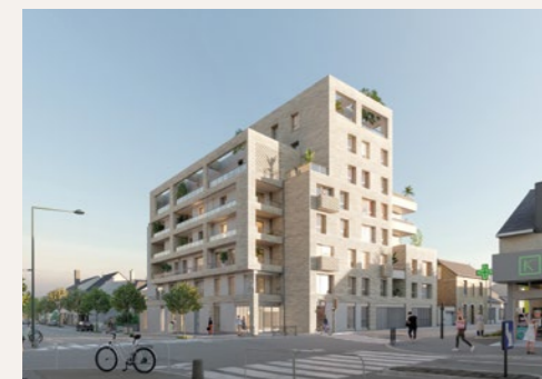
NÍKI Rennes (Clémenceau)

Nos programmes dans la métropole rennaise