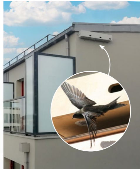
Nichoir à martinets

Afin de préserver et protéger la faune locale, des nichoirs à martinets en béton végétal et des hôtels à insectes seront installés.