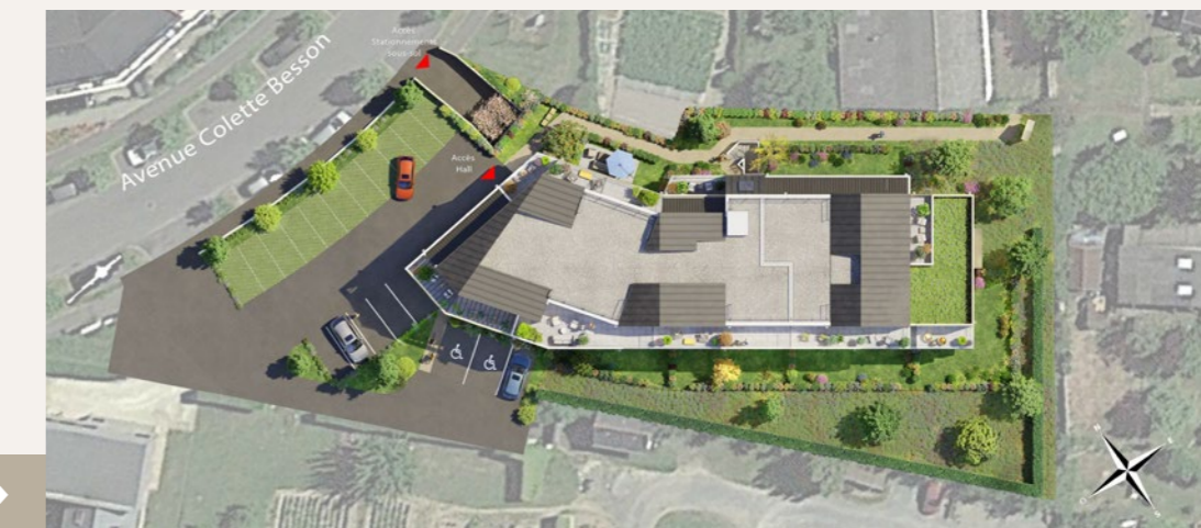
Plan masse de la résidence →

Le projet bénéficie en outre d'un grand garage à vélos situé au niveau rez-de-chaussée éclairé naturellement et d'un accès piéton direct à la route de Nantes à proximité de la médiathèque.