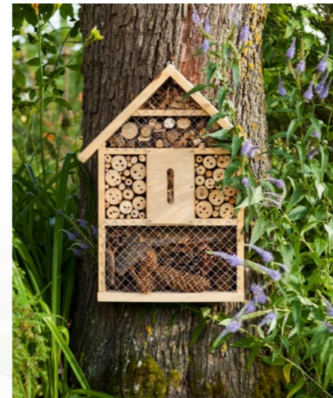
Hôtel à insectes

En parallèle, les résidents auront la possibilité de cultiver un potager en profitant du compost qu'ils pourront récupérer sur l'aire de compostage aménagée à l'arrière de la résidence.