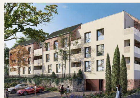
BRICK LODGE Chartres-de-Bretagne