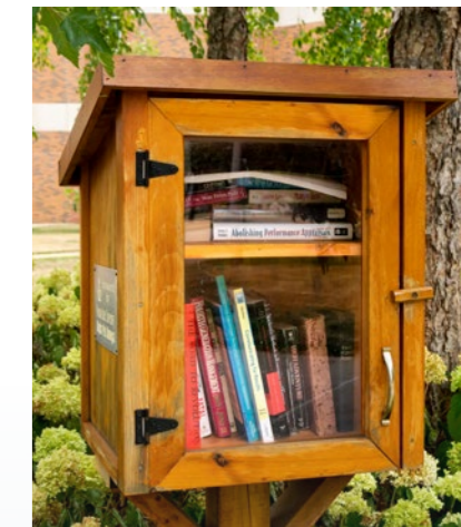
Boîte à livres

Espace vert commun, boîte à livres, aire de compostage, prairie fleurie... sont de réels atouts propices à la préservation du site et au bien-être de chaque résident .