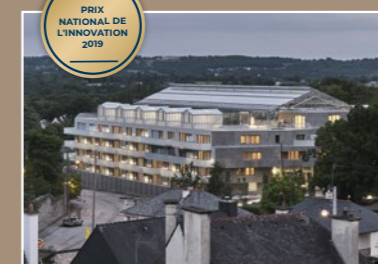
Utopia, Bruz (35)