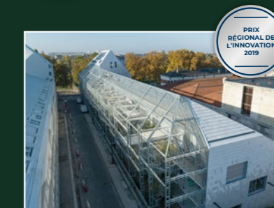
Ekko, Bordeaux (33)