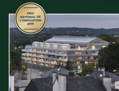
Utopia, Bruz (35)