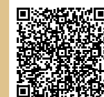
PRISMA Les Sorinières (Centre-ville) Scannez le QR code pour le découvrir

Une expertise des résidences dédiées aux seniors