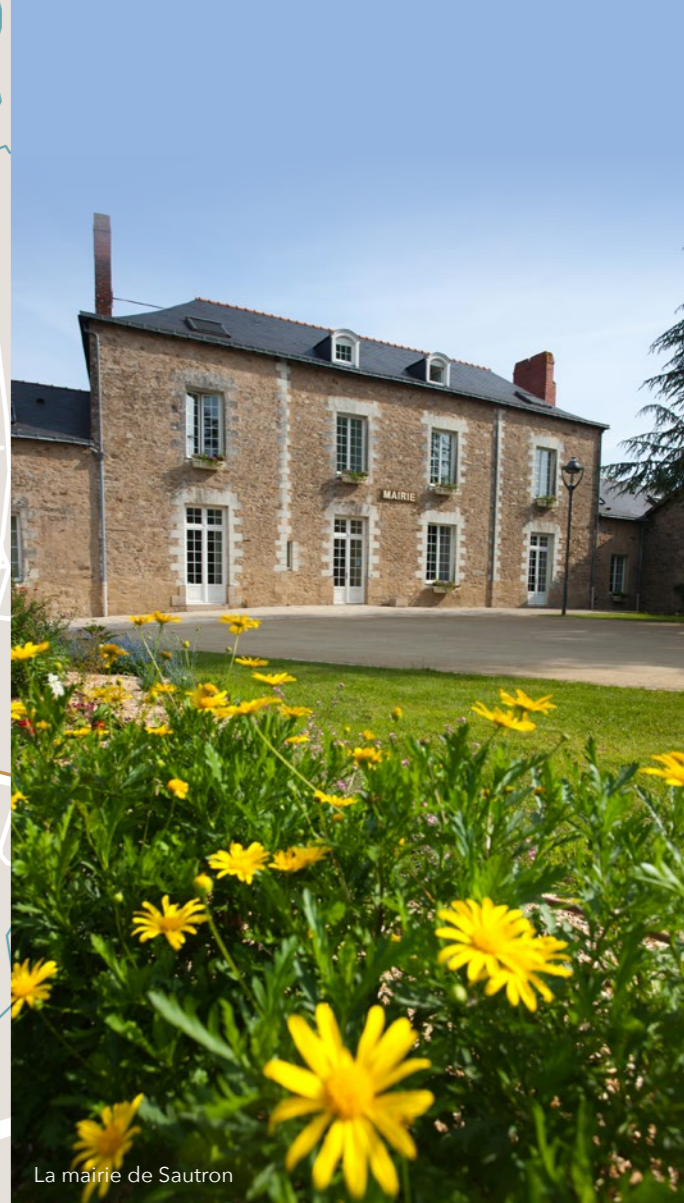
La mairie de Sautron