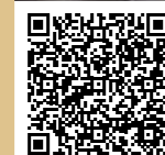
STREAM Nantes (Saint-Félix) Scannez le QR code pour le découvrir