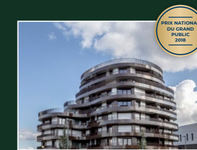
Wavy, Cesson-Sévigné (35)