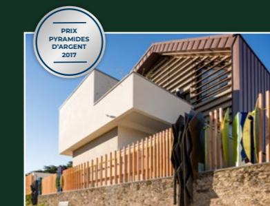
Le Clos des Baronnie, Nantes (44)