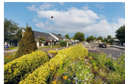
Le centre commercial du Cormier

Verdoyante , la commune de Sautron a su préserver ses grands espaces verts pour le bonheur des amateurs de belles balades. À pied ou à vélo, les Sautronnais profitent des chemins de randonnées.