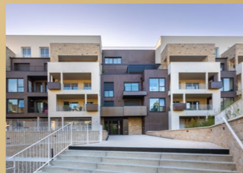
BELLAGIO Saint-Grégoire - Centre-ville (35)