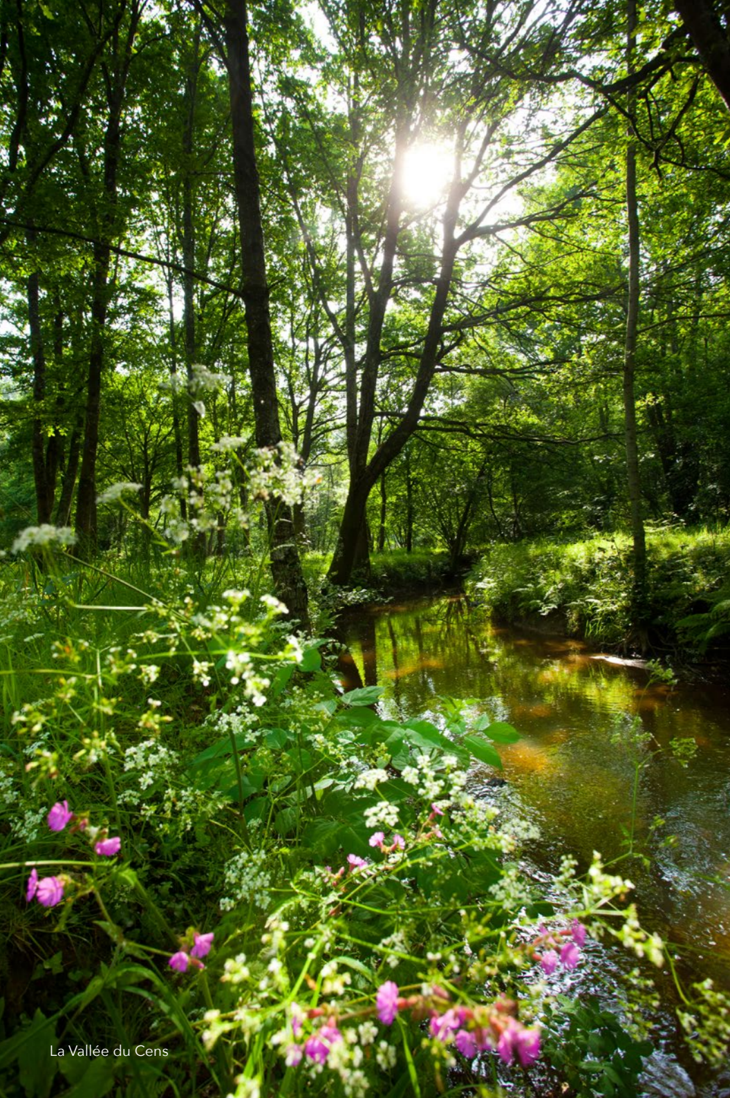
La Vallée du Cens