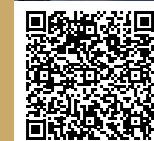
CARAT Nantes (Saint-Félix) Scannez le QR code pour le découvrir