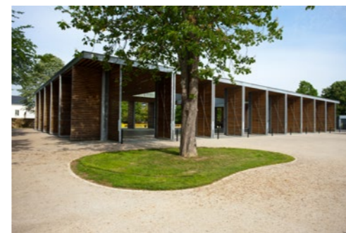
La halle de la Linière