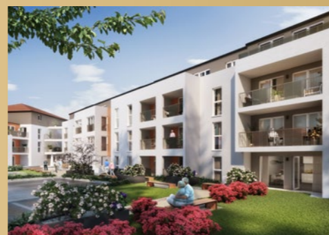
RÉSIDENCE DU MOULIN Bouaye - Centre-ville (44)

Une expertise des résidences dédiées aux seniors