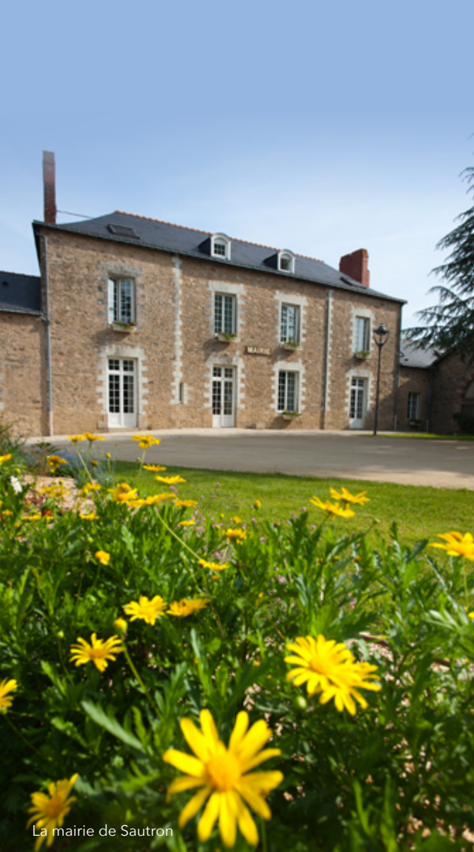
La mairie de Sautron