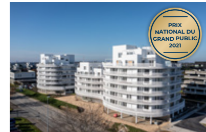
Lily, Cesson-Sévigné (35)