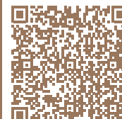
L'ORÉE DU PARC Saint-Nazaire Scannez le QR code pour le découvrir