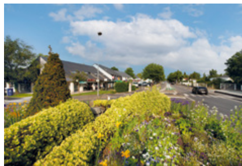
Le centre commercial du Cormier

Verdoyante , la commune de Sautron a su préserver ses grands espaces verts pour le bonheur des amateurs de belles balades, à pied ou à vélo.