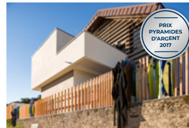
Le Clos des Baronnies, Nantes (44)