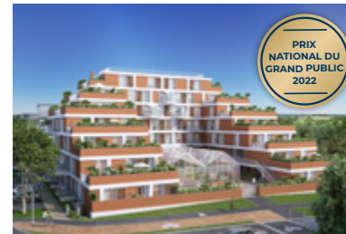
Happy, Cesson-Sévigné (35)