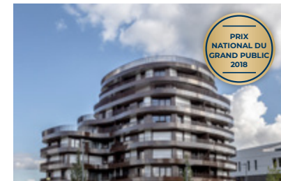
Wavy, Cesson-Sévigné (35)