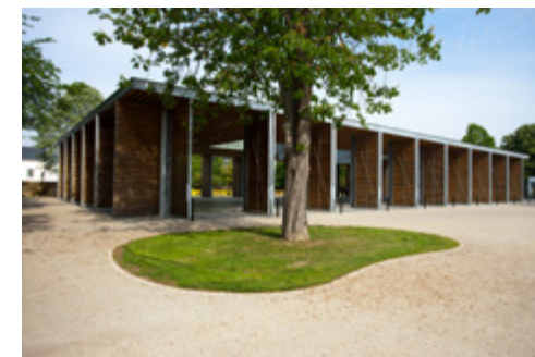
La halle de la Linière