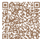
SOLEIA Nantes (Civelière) Scannez le QR code pour le découvrir