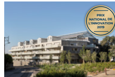
Utopia, Bruz (35)