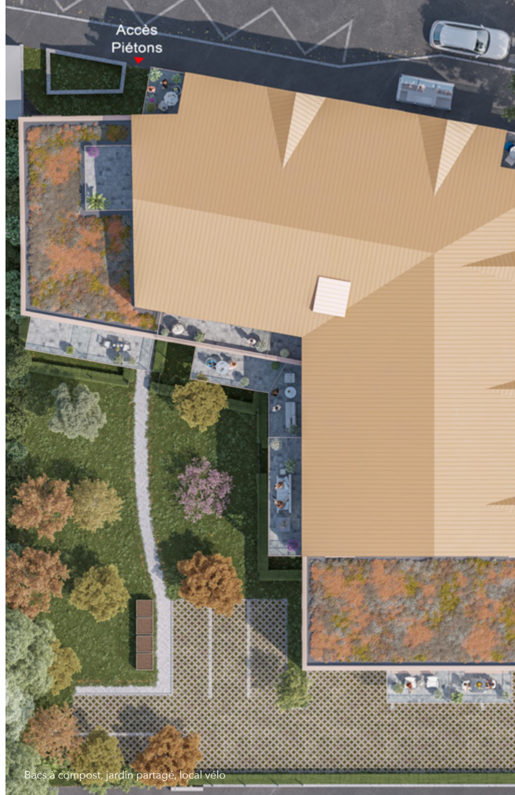
Bacs à compost, jardin partagé, local vélo

Un espace à l' atmosphère bucolique sera aménagé en cœur d'îlot . Composé, à la fois d'arbres et d'arbustes persistants pour apporter de la fraîcheur en plein été et, d'essences fleuries locales et esthétiques pour soutenir l'écosystème, le jardin partagé façonne un cadre de vie accueillant.