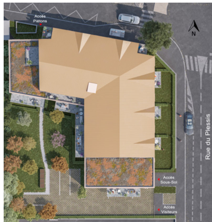
Plan masse de la résidence