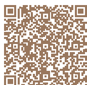
SÈVRE & CONFLUENCE Nantes (Sud) Scannez le QR code pour le découvrir