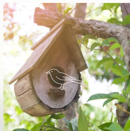
Nichoir à oiseaux