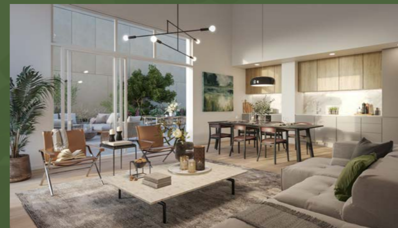
Visuel 3D réalisé à partir des plans d'architecte de l'appartement N°A61