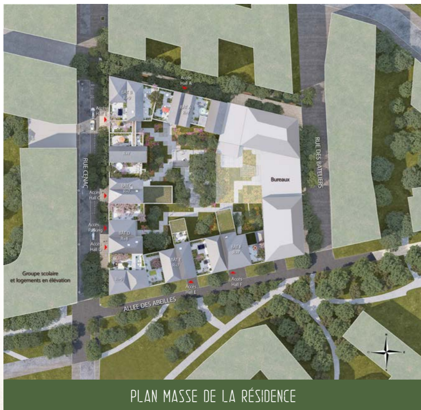
PLAN MASSE DE LA RÉSIDENCE

« C'est une bastide contemporaine qui accueille, en son cœur, un îlot paysager à partager et qui s'ouvre, en périphérie, sur la métropole bordelaise. Ce sont autant de bâtiments mitoyens accolés qui constituent l'écrin de ce jardin en ville.