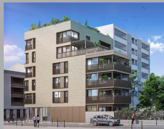
Palazzo Lyon 3