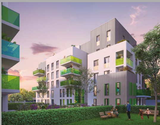
Green Light Villeurbanne