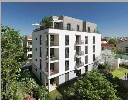
Grey Cedar Lyon 8