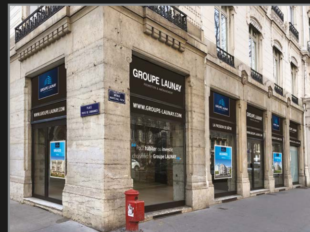
Agence Lyon-Rhône-Alpes située 45 avenue Foch, au cœur du 6 e arrondissement de la ville de Lyon.

Cette belle aventure repose, avant tout, sur une passion de tous les instants partagée par chacun de nos collaborateurs : Aménager et Bâtir.