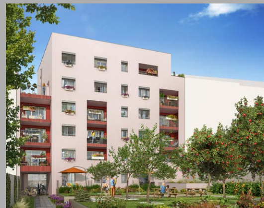
Square Verde Villeurbanne