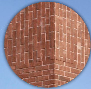
Calepinage des briques