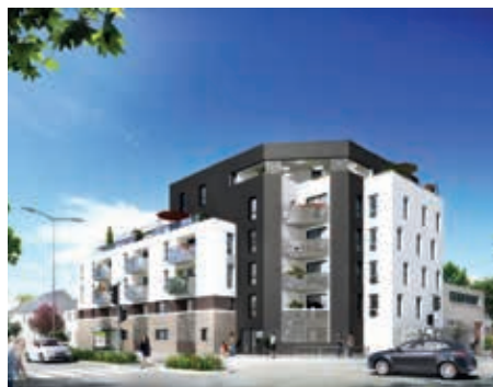
Villa Bel Air - Rennes