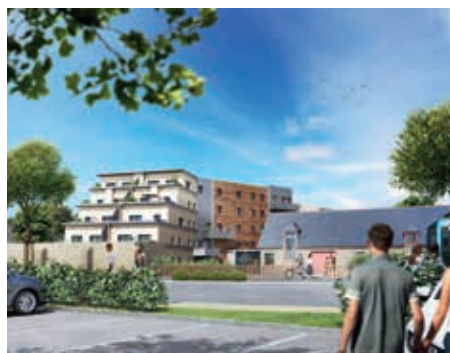
Les Terrasses de Cucé - Chantepie