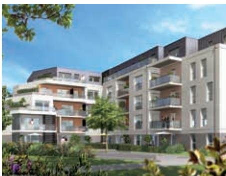
Jazz - Cesson Sévigné