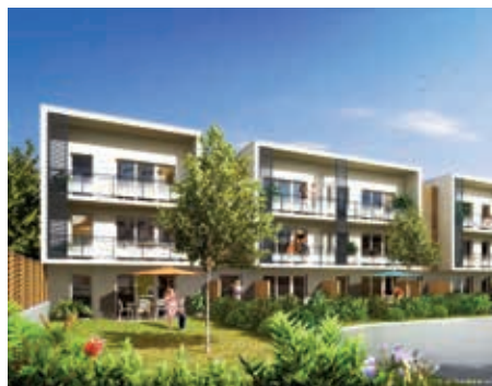
Villas Jasmin - Noyal-sur-Vilaine