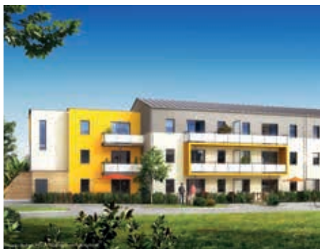
Villa des Arts - Pont-Péan