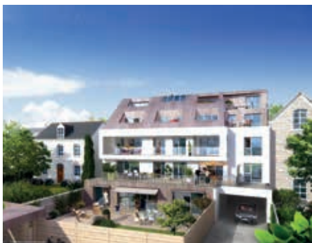
Villa Palestine - Rennes

Résidences proposées par le Groupe Launay sur Rennes et sa région :