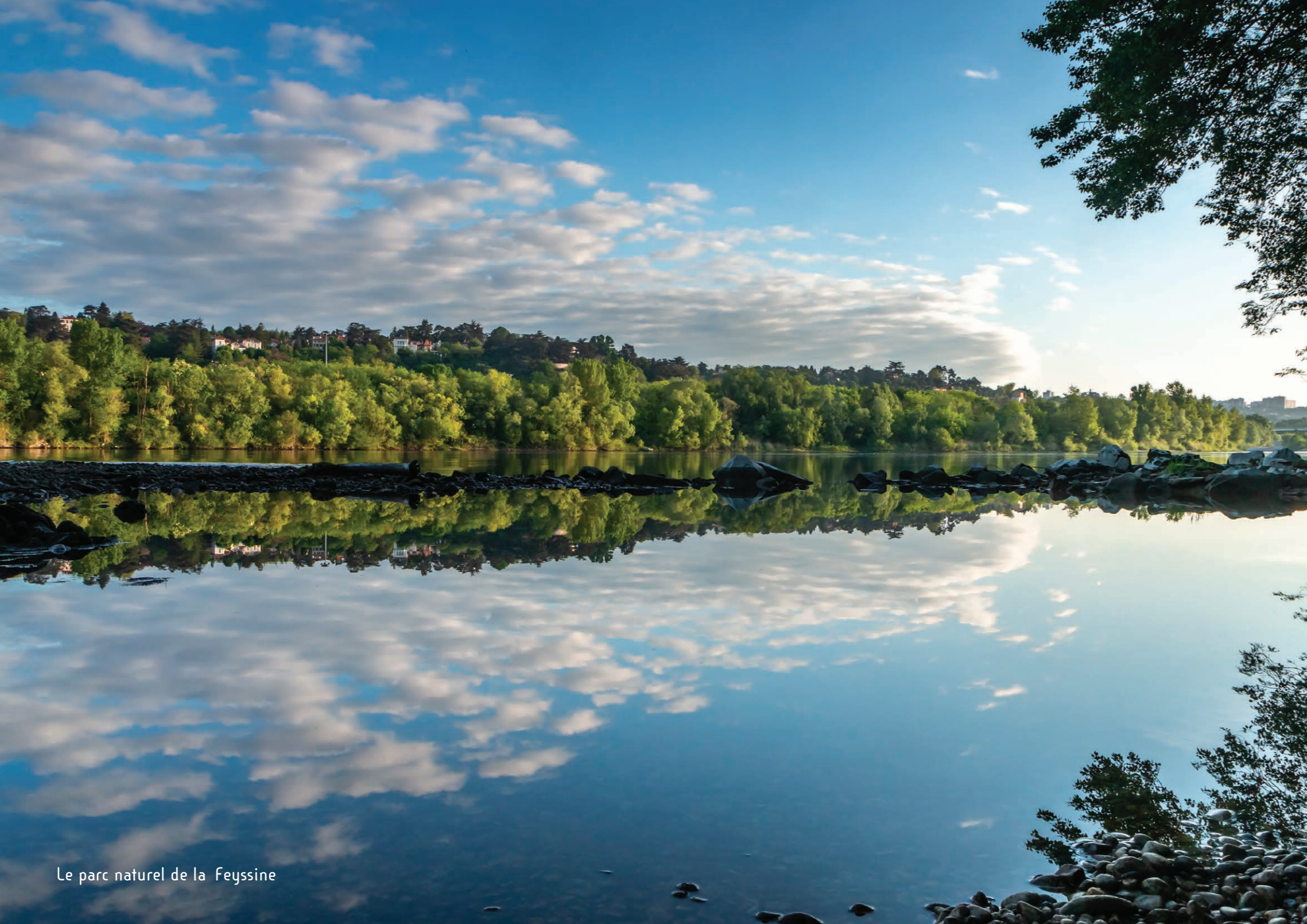
Le parc naturel de la Feyssine