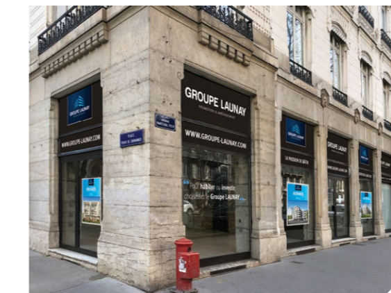
Agence Lyon-Rhône-Alpes située 45 avenue Fach, au cœur du 6 ème arrondissement de la ville de Lyon.

Qualité des emplacements, élégance de l'architecture, harmonie des ambiances intérieures et préservation de l'environnement sont les atouts des réalisations du Groupe LAUNAY. Son sens du service et l'écoute de ses clients lui permettent de réaliser des projets porteurs d'identité , afin de répondre aux attentes des utilisateurs et à leur exigence patrimoniale.