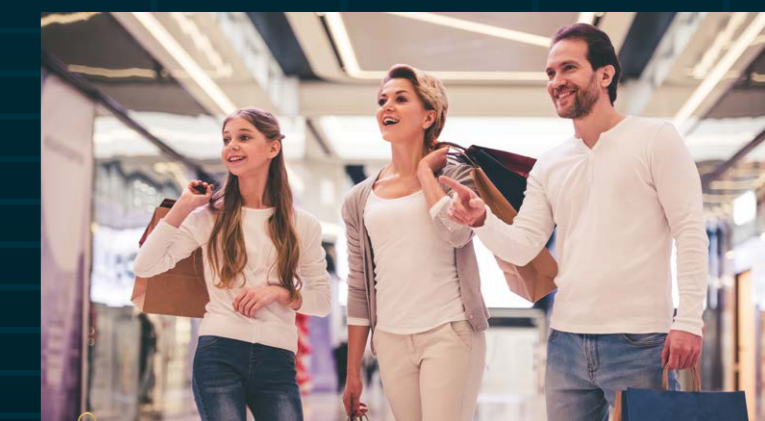
Le centre commercial ALMA à 7 min en vélo