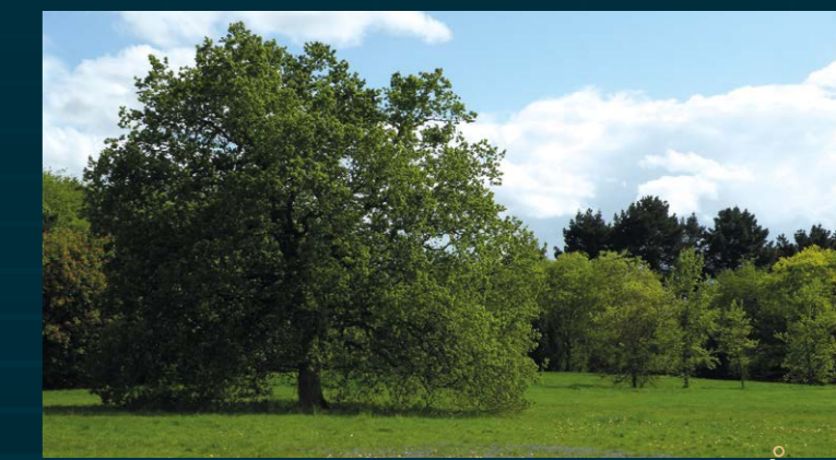
Le Parc de BRÉQUIGNY à 7 min en vélo