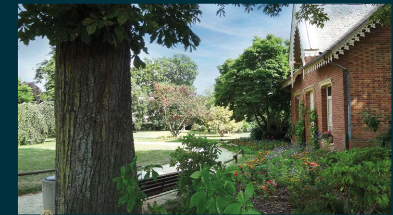
Le Square de VILLENEUVE à 7 min à pied