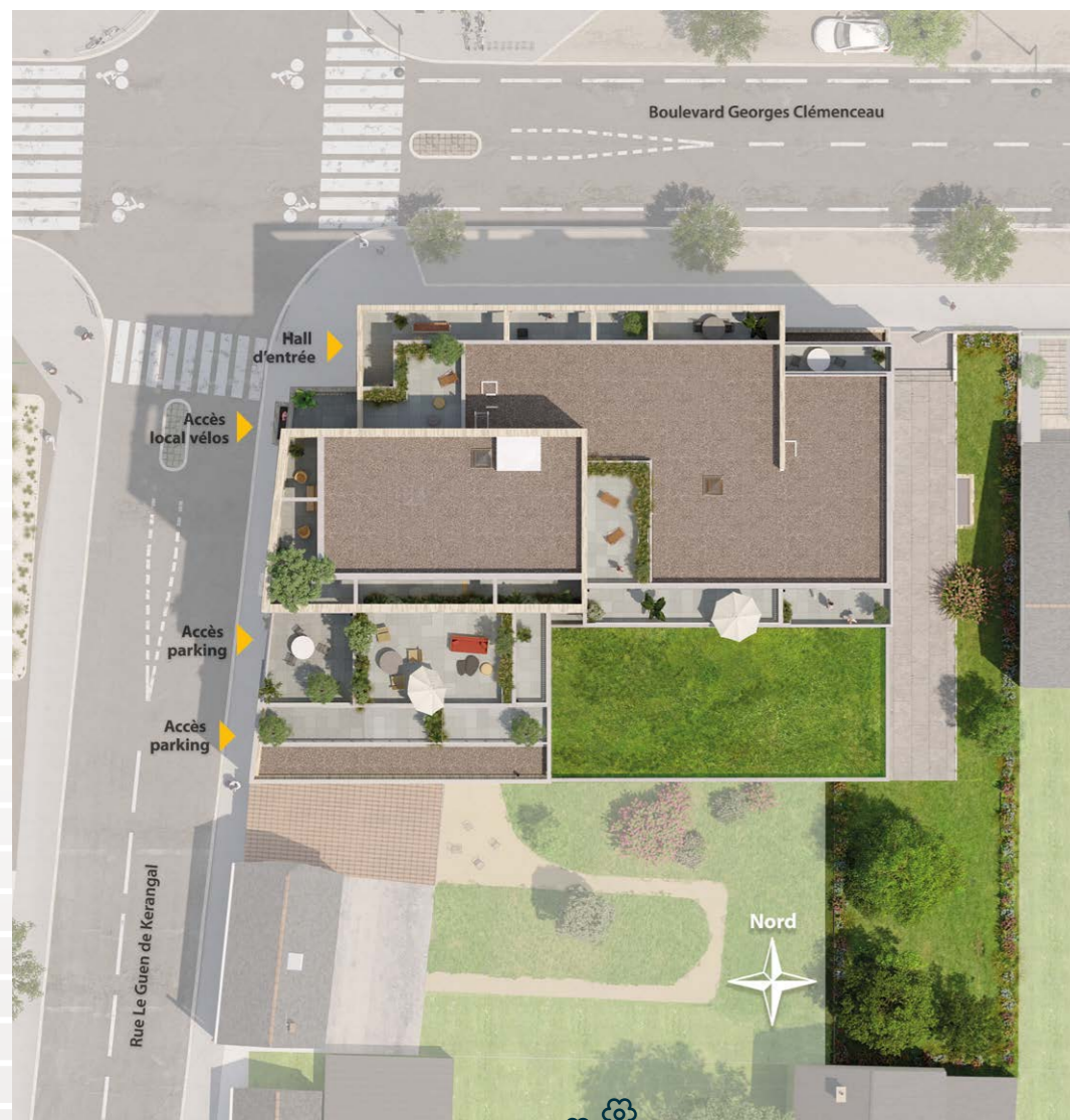
» PLAN MASSE DE LA RÉSIDENCE