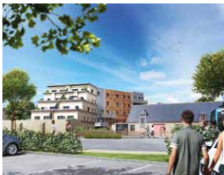
Les Terrasses de Cucé - Chantepie