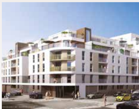
Oxygen - Rennes