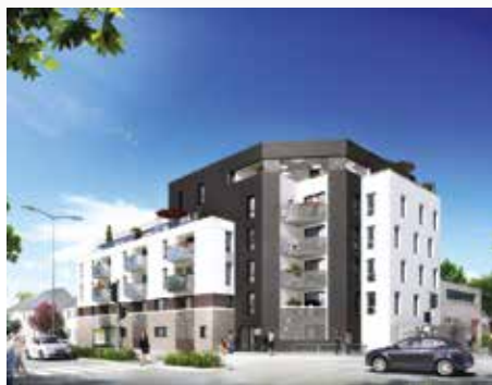
Villa Bel Air - Rennes