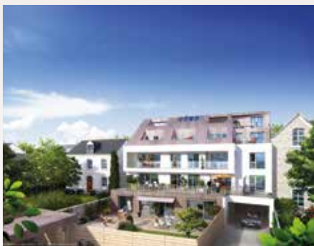
Villa Palestine - Rennes

Résidences proposées par le Groupe Launay sur Rennes et sa région :