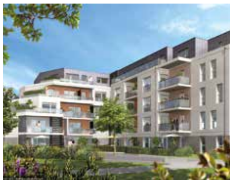
Jazz - Cesson-Sévigné