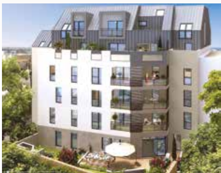
Elixir - Rennes