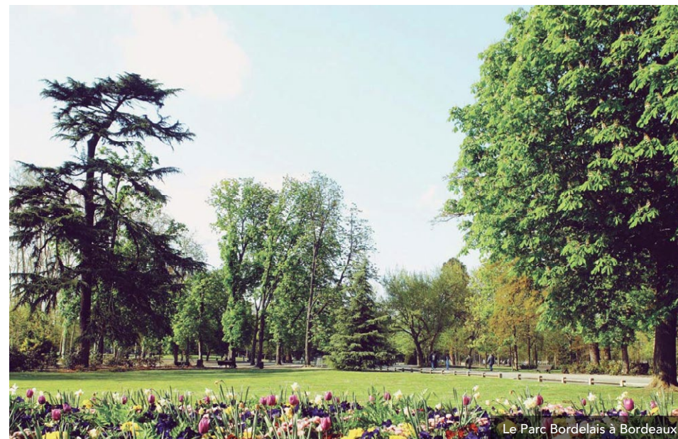
Le Parc Bordelais à Bordeaux

Idéalement située , Bordeaux-Métropole profite des atouts de l'Arc Atlantique, véritable ruban de dynamisme territorial qui s'étend du nord au sud de l'Europe océanique. Bordeaux-Métropole dispose également d' infrastructures de transport performantes : une gare TGV / LGV / TER qui place Paris à 2h04 en train, un aéroport international aussi pratique pour les affaires que pour les vacances et l'accès rapide à 4 autoroutes majeures (A10, A62, A63, A89).