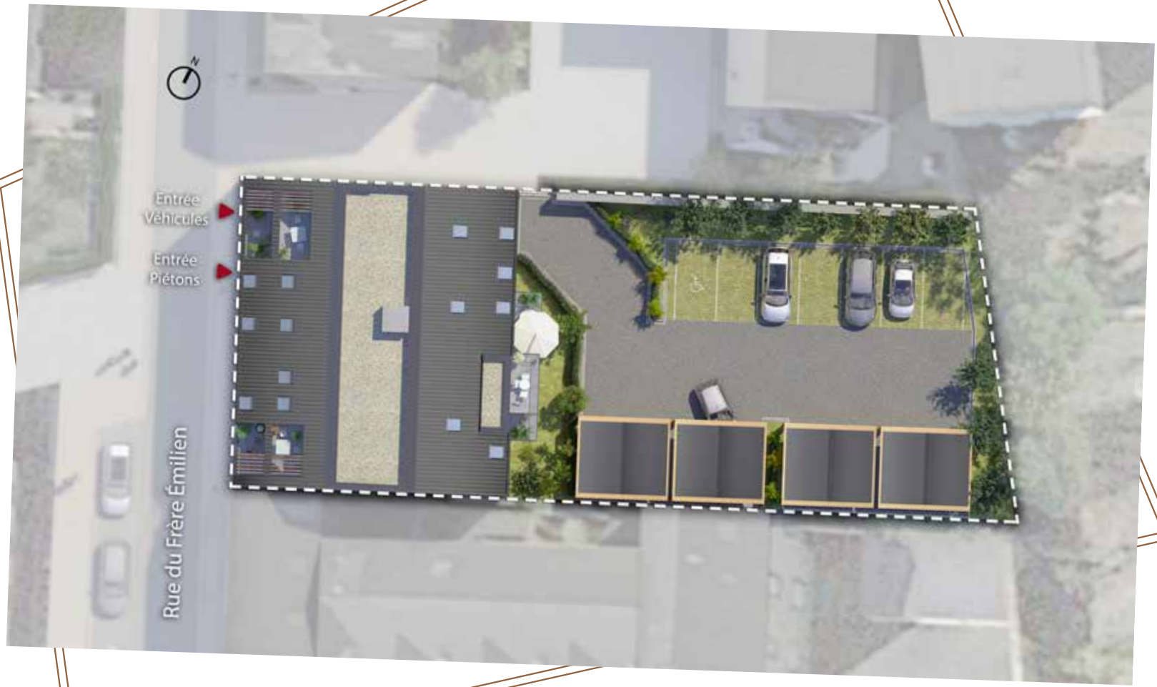
Plan masse de la résidence