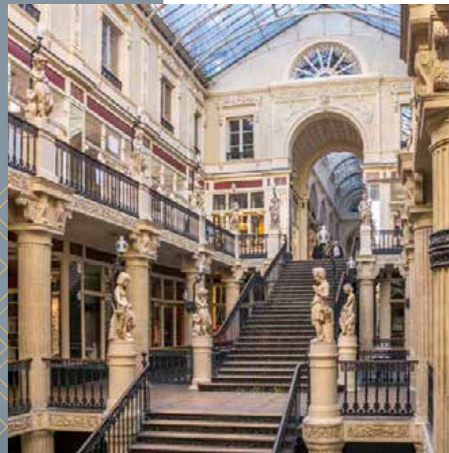
Le Passage Pommeraye, chef-d'œuvre de l'architecture classé monument historique.