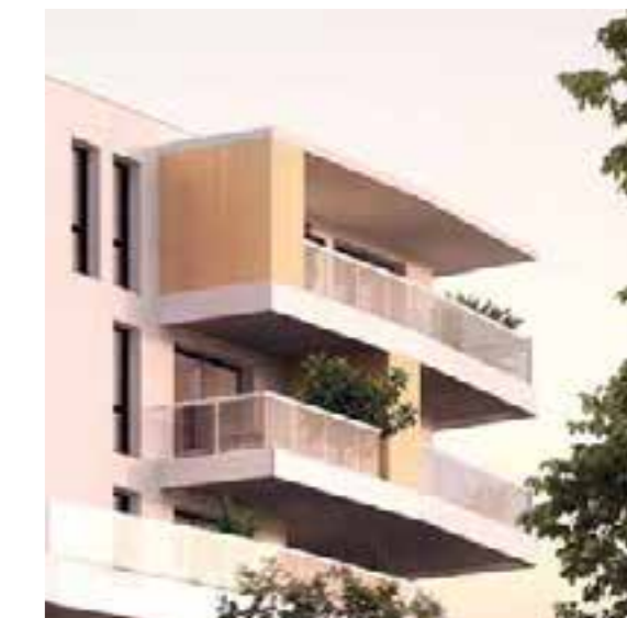
De larges balcons filants rythment la façade.

L'architecture de Folies de Sèvre est une promesse de design et de distinction. Avec ses matériaux nobles, ses couleurs pures, ses larges balcons et son esprit « millefeuille », la résidence s'intègre parfaitement à son environnement d'exception. Les arbres et les haies plantés au pied de la résidence, viennent à la fois protéger l'intimité des habitants et créer une liaison douce entre la nature avoisinante et le bâtiment.