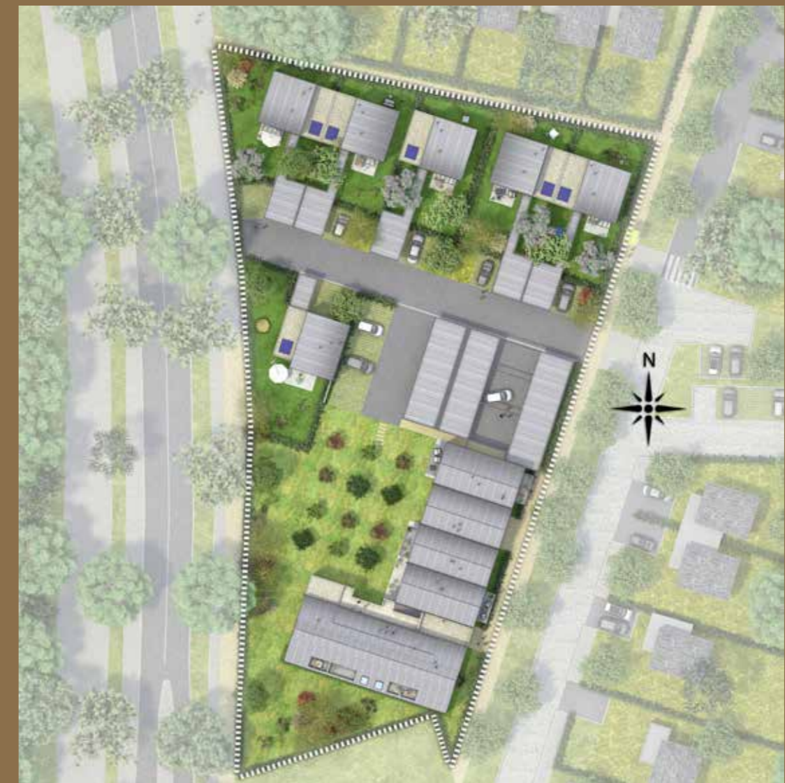
Plan masse du Domaine d'Artémis