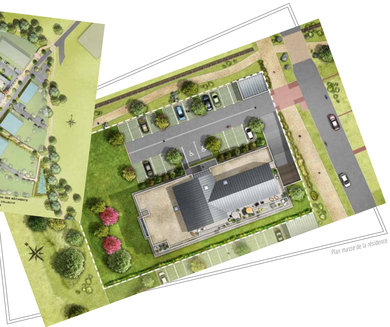
Plan masse de la résidence