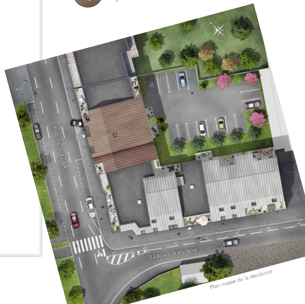
Plan masse de la résidence