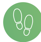
Parcours de promenades