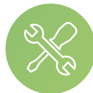
Services à domicile

Cette salle commune de convivialité, se situe au rez-de-chaussée et permet la mise en place d' activités hebdomadaires . Cet espace de vie crée un réel lien social en proposant un espace « détente », avec un coin lecture et des jeux de société. Une terrasse partagée ainsi qu'une cuisine équipée sont également à disposition des résidents.