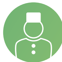
Service de conciergerie

Une personne dédiée à l'animation propose une permanence du lundi au vendredi au sein de la résidence , pour rythmer le quotidien des résidents. Elle organise différents ateliers, soit dans la salle commune de convivialité (atelier cuisine, jeux de société, anniversaires...), soit en extérieur, via des activités comme le jardinage ou les promenades. Elle élabore également une gazette interne, mise à disposition des résidents.