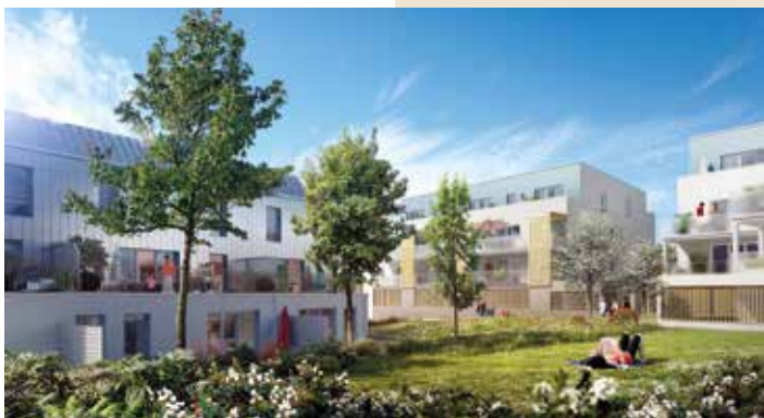
Nuance - Thouaré-sur-Loire