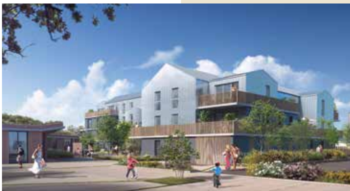
Alhéna - Saint-Herblain