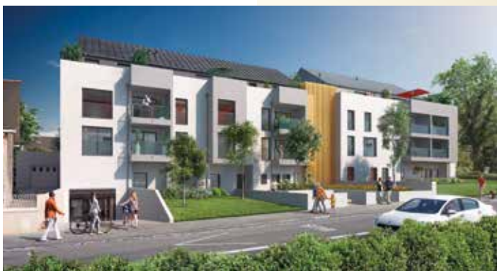
Aurore - Nantes