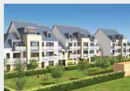
Les Ancres Marines à LE CROISIC