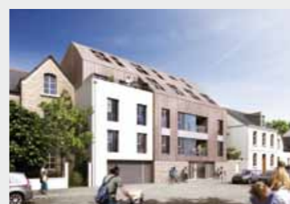
Villa Palestine à RENNES