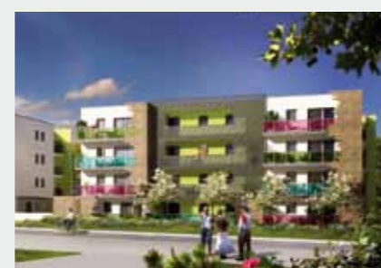
Villa Solaris à SAINT-AVÉ

Résidences proposées par le Groupe Launay sur la région Ouest