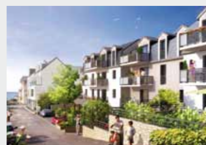
La Villa à PLENEUF VAL-ANDRÉ

HELVETIA - 06 83 27 01 52 - Document non contractuel - Images Aka Studio - Fotolia.com - Pivovoi - Marc Josse - 06/14