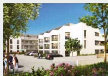
Cœur Emeraude à CHARTRES-DE-BGNE