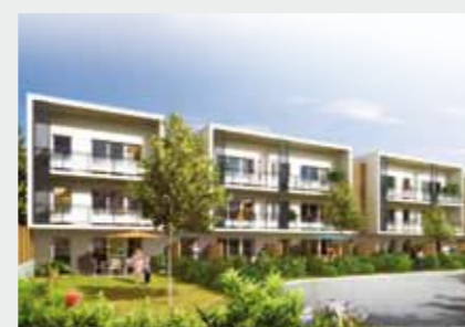
Villas Jasmin à NOYAL-SUR-VILAINE