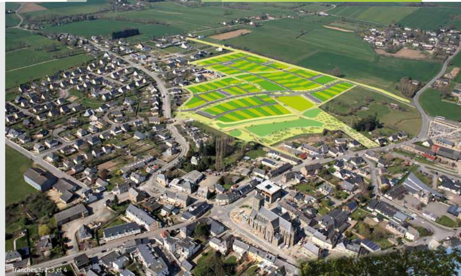
Tranches 1, 2, 3 et 4